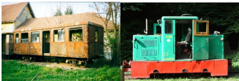
Historický osobný vozeň a lokomotíva C-50 na železnici v Nagybörzsöny.

15.1.2021 – Uskutočnilo sa otvorenie projektu, stretnutie projektového manažmentu a nasledovalo stretnutie projektových tímov. Aj keď otvorenie projektu a staff meetingy boli pôvodne plánované ako osobné stretnutia, pre epidemickú situáciu sa uskutočnili v online priestore.