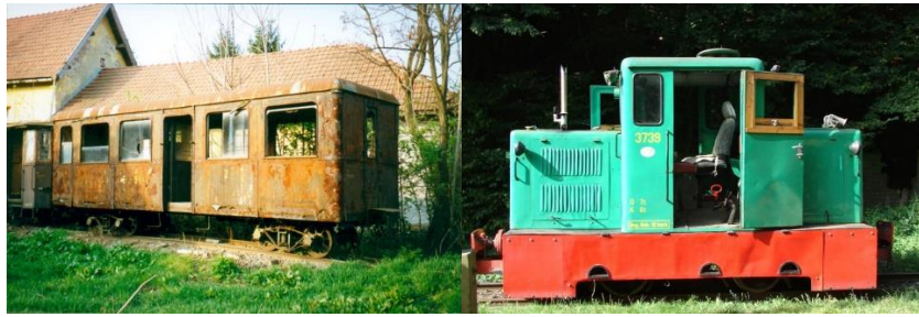
A BA kocsi és a C-50 mozdony aktuális látképe a Nagybörzsönyi Erdei Kisvasúton

2021. január 15-én valósult meg a projekt hivatalos megnyitója, melynek keretén belül megismerkedett a projektmenedzsment összes tagja a világjárványra való tekintettel legalább az on-line térben, valamint utána az első értekezletre (staff meeting) került sor. A sajtótájékoztatóval egybekötött ünnepélyes projekt megnyitó elmaradt.