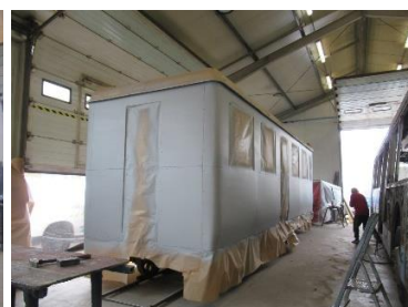
B1 - Oprava historického osobného vozňa