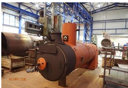
LB - Výroba nového kotla pre parnú lokomotívu Katka.